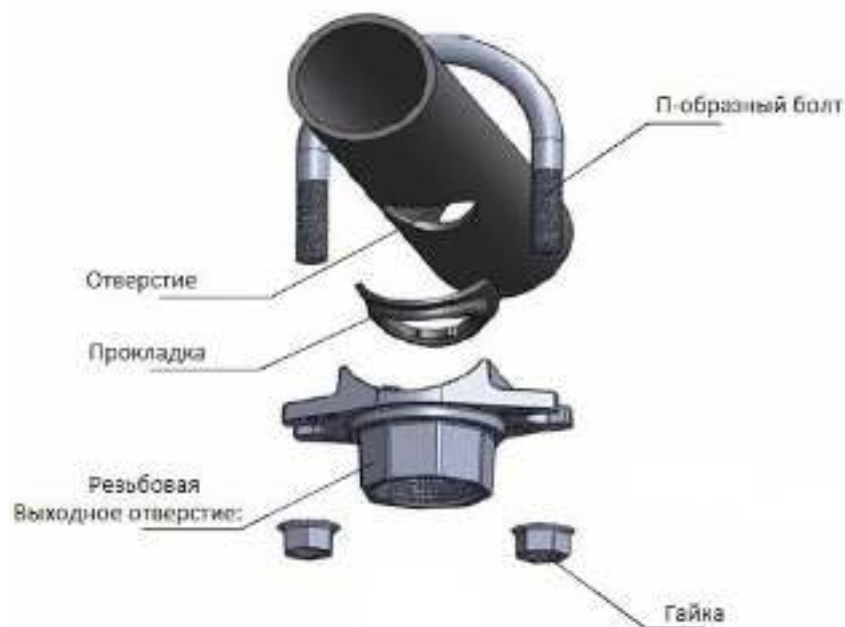
Рис.3. Гравлочное соединение отвод (седелка) резьбовой Ubolt 041.